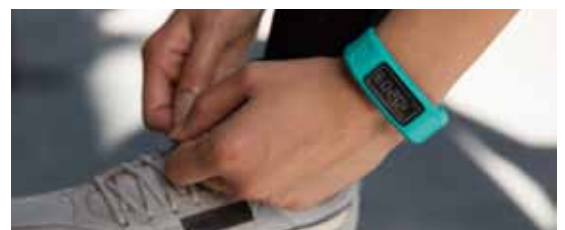
Neu bei Garmin: das Vivofit-Armband.

Das US-Unternehmen Garmin ist vor allem als Hersteller von Navigationsgeräten bekannt. Jetzt hat Garmin das Fitnessarmband „Vivofit“ auf den Markt gebracht, das im Vergleich zu Konkurrenzprodukten ein eigenes Display besitzt. Die Analysten der Citigroup sehen in Vivofit das nächste große Ding für Garmin und bestätigen ihre Kaufempfehlung für die Aktie. Auch der Dividende-4-Plus-Fonds setzt auf weitere Kurssteigerungen bei der Garmin-Aktie – und auf weiterhin hohe Ausschüttungen. Denn Garmin weiß auch mit einer Dividendenrendite von 3,3 Prozent zu überzeugen.