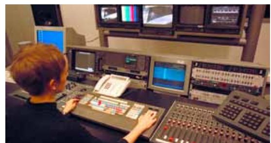
Gute Mischung: Pro7 verdient weiterhin gutes Geld.

Für das erste Quartal 2014 wurden 0,11 Euro pro Anteilswert ausgezahlt, was einer Rendite von 1,1 Prozent entsprach. Im zweiten Quartal wird dank der zahlreichen Dividendenzahlungen diverser Unternehmen eine Ausschüttung von über zwei Prozent angestrebt. Auch Anleger, die jetzt noch einsteigen, erhalten die volle Ausschüttung für das zweite Quartal.