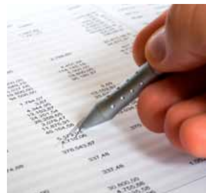
Die Rechnung geht auf – die Man Group zahlt regelmäßig hohe Dividenden.

Obwohl die britische Man Group mit einem verwalteten Vermögen von über 50 Milliarden Dollar kein Leichtgewicht in der Finanzbranche ist, dürften nur wenige deutsche Anleger das Unternehmen kennen. Dabei lohnt sich gleich in mehrfacher Hinsicht ein genauerer Blick. Die Man Group zahlt seit 2004 ohne Ausnahme Dividende. Die aktuelle Dividendenrendite liegt bei beachtlichen 4,1 Prozent. Zuletzt machte die Aktie zudem mit stark steigenden Kursen auf sich aufmerksam. Seit der Aufnahme in den Dividende-4-Plus-Fonds im Januar beläuft sich der Wertzuwachs schon auf 23 Prozent.