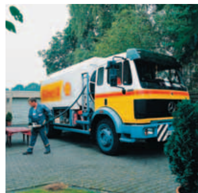
Bei Royal Dutch Shell laufen die Geschäfte wie geschmiert.

Öl-Aktien sind im laufenden Jahr so etwas wie die heimlichen Gewinner an der Börse. Kaum ein Anleger hatte beispielsweise Royal Dutch Shell zu Jahresbeginn auf der Rechnung. Doch der Aktienkurs kann kräftig zulegen – und das trotz einer sinkenden Produktion. Die Strategie, sich auf lukrative Projekte zu konzentrieren, zahlt sich aus. Zusätzlich hat auch der Ölpreis zuletzt angezogen. Dies dürfte den Free Cashflow beflügeln. Dazu stützt das laufende Aktienrückkaufprogramm den Kurs der Aktie des Öl- und Gasproduzenten. Das Papier ist eine der Top-10-Positionen im Dividende-4-Plus-Fonds.