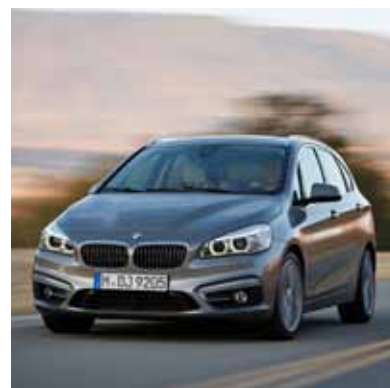
Fahrzeuge der Marke BMW kommen bei den Autokäufern an.