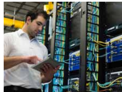
Vodafone baut im Moment sein Geschäftsfeld aus.

Der britische Telekomkonzern Vodafone hat die Übernahme des spanischen Kabelanbieters Ono abgeschlossen. Für die Anteile der Spanier zahlte er wie geplant insgesamt 7,2 Milliarden Euro. Im März hatte der Konzern die Übernahme angekündigt. Derzeit kauft sich der ehemals reine Mobilfunkher in vielen Teilen Europas Kabelnetze, um seinen Kunden Komplettpakete aus Telefon, Fernsehen und Breitband-Internet anbieten zu können. Vodafone denkt aber auch an seine Aktionäre. So schüttete der Konzern in diesem Jahr neben der regulären Dividende noch eine Sonderdividende aus.