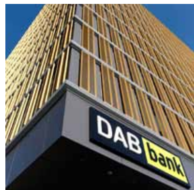
BNP Paribas reißt sich den Onlinebroker DAB unter den Nagel.

Kursexplosion bei der DAB Bank: Das Papier des Onlinebrokers ist am Freitag um 15 Prozent nach oben geschossen. Der Grund: Die französische Großbank BNP Paribas übernimmt den Onlinebroker. Damit entsteht unter den Direktbanken ein neues Schwergewicht. In Deutschland ist BNP bereits mit Cortal Consors vertreten. Zusammen haben Cortal Consors und DAB 1,4 Millionen Kunden und verwalten ein Vermögen von 58 Milliarden Euro.