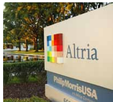
Der Zigarettenhersteller Altria befindet sich voll auf Kurs.

Der Marlboro-Hersteller Altria hat im zweiten Quartal weniger verdient als ein Jahr zuvor. Neben rückläufigen Zigarettenverkäufen drückten Belastungen durch Rechtsstreitigkeiten auf das Ergebnis. Das untere Ziel für den Jahresgewinn wurde trotzdem angehoben. Zudem legte Altria ein milliardenschweres Aktienrückkaufprogramm auf. Für das laufende Jahr peilt Altria einen um Sondereffekte bereinigten Gewinn je Aktie zwischen 2,54 und 2,59 Dollar an (vorher lag die Spanne zwischen 2,52 und 2,59 Dollar). Dies wären sieben bis neun Prozent mehr als im Vorjahr. Der Titel ist mit 1,8 Prozent im Dividende-4-Plus-Fonds gewichtet. Die Dividendenrendite von Altria liegt aktuell bei über 4,5 Prozent.