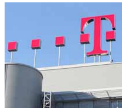
Die Aktie der Telekom überzeugt durch eine hohe Dividendenrendite.

Der französische Internet- und Mobilfunkanbieter Iliad sucht für seinen geplanten T-Mobile-US-Kauf laut einem Pressebericht möglicherweise Unterstützung von Technologie-Branchenriesen. So hätten die Franzosen unter anderem bei Google und Microsoft vorgeschlagen, um mit deren finanzieller Hilfe ihr Angebot aufbessern zu können. Mit einer Dividendenrendite von aktuell rund 4,5 Prozent ist auch die Telekom-Aktie im Dividende 4 Plus Fonds vertreten.