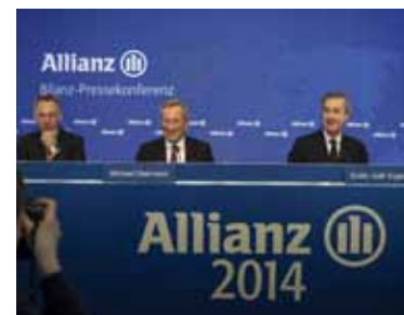
Das Management der Allianz hat gut lachen – die Aktie notiert auf 8-Jahres-Hoch.

Zudem überzeugte bereits im Januar das vorhandene Kurspotenzial des größten deutschen Versicherungskonzerns. Das beginnt die Allianz-Aktie jetzt abzurufen. Allein in den vergangenen vier Wochen hat der Wert um 14 Prozent zugelegt und ist mit 138 Euro auf das höchste Niveau seit acht Jahren gestiegen. Vom Allzeithoch ist der Finanztitel indes noch weit entfernt. Das liegt bei 441 Euro und stammt aus dem Jahr 2001.