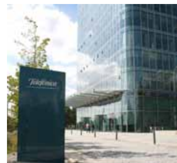
Telefónica ist der größte Mobilfunkanbieter in Deutschland.