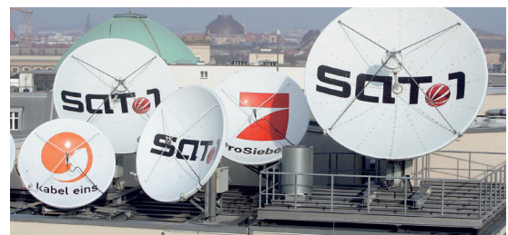
Bei ProSiebenSat.1 rollt der Rubel. Das kommt auch an der Börse an.

ProSiebenSat.1 überraschte die Marktteilnehmer in der vergangenen Woche mit einem starken Ausblick. Der Konzern will das für 2015 festgelegte Umsatzwachstumsziel von 800 Millionen Euro im Vergleich zum Jahr 2010 bereits Ende 2014 erreichen. Auch auf dem Weg zu dem für 2018 ausgegebenen Ziel einer Umsatzsteigerung um eine Milliarde Euro gegenüber 2012 komme man gut voran. Mit knapp 50 Minderheitsbeteiligungen ist ProSiebenSat.1-Media längst kein normaler TV-Sender mehr, sondern auch eine Venture-Capital-Gesellschaft. Die Aktie zählt zu den Top-Positionen im Dividende-4-Plus-Fonds.