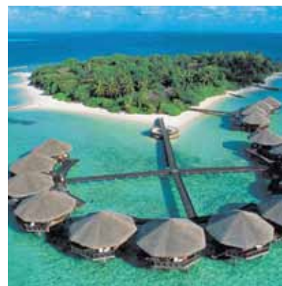
Endlich ausspannen: Dank TUI wird der Traum von der einsamen Insel Realität.

Der Weg für die Fusion von TUI und TUI Travel ist frei: Die Aktionäre von Europas größtem Reisekonzern und seiner selbstständigen britischen Veranstaltertochter haben mit großer Mehrheit der Verschmelzung beider Unternehmen zugestimmt. Mit vereinter Schlagkraft soll die neue TUI AG bald deutlich mehr Gewinn aus den eigenen Hotels und Kreuzfahrtschiffen sowie dem Geschäft als Reiseveranstalter ziehen. TUI Travel gehört bislang nur zu 54 Prozent der TUI AG. Durch den Zusammenschluss entsteht der größte Reisekonzern der Welt. TUI Travel befindet sich im Dividende 4 Plus Fonds und ist mit einer Dividendenrendite von über drei Prozent eine echte Perle.