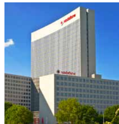
Vodafone ist dank Übernahmen auf Wachstumskurs.

Mit Zukäufen in Europa baute der britische Mobilfunkanbieter Vodafone sein Geschäft im laufenden Jahr weiter aus. Wegen der Übernahme der Kabelnetzbetreiber Ono in Spanien und Kabel Deutschland kletterte der Umsatz im ersten Geschäftshalbjahr im Jahresvergleich um knapp neun Prozent auf 20,75 Milliarden Britische Pfund. Das Ergebnis vor Zinsen, Steuern und Abschreibungen (EBITDA) legte um fast sechs Prozent auf 5,88 Milliarden Pfund zu. Vodafone überzeugt zudem mit einer Dividendenrendite von mehr als fünf Prozent.