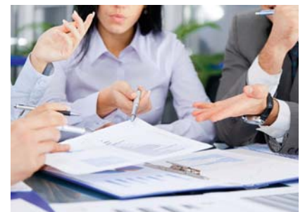
Die Analysten sehen noch deutliches Kurspotenzial bei Drillisch.

Trotz der Rallye in den vergangenen Jahren sehen die Experten bei Drillisch noch viel Luft nach oben. So hat die US-Bank Citigroup kürzlich die Einstufung für Drillisch auf „Buy“ mit einem Kursziel von 42 Euro belassen. Analyst Simon Weeden erhöhte seine Prognose für den operativen Gewinn (EBITDA) für 2015 von 78 auf 98 Millionen Euro. Seiner Meinung nach bietet der jüngste Kursrückgang Anlegern eine attraktive Einstiegsgellegenheit. Mit einer Dividendenrendite von über fünf Prozent ist Drillisch auch im Dividende-4-Plus-Fonds vertreten. Die Position befindet sich bereits gut 20 Prozent im Gewinn.