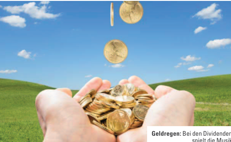
Geldregen: Bei den Dividenden spielt die Musik

zent der befragten Kleinanleger sogar eine geringere Kurssteigerung in Kauf nehmen.