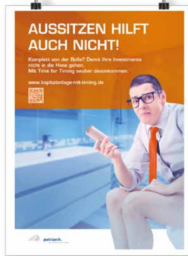
Poster DIN A1