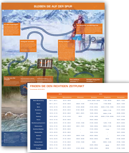
Falt-Flyer DIN A5 (aufgefaltet DIN A2)