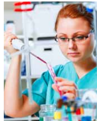
Gilead Sciences arbeitet hochprofitabel – dies macht sich am Kurs bemerkbar.

Die Aktien von Gilead Sciences zählen zu den Top-Performern im Patriarch Classic TSI Fonds. Seit Aufnahme in das Portfolio hat der Wert über 45 Prozent zugelegt. Die Rallye der Biotech-Aktie dürfte damit aber noch lange nicht zu Ende sein. Im Gegenteil – die Experten von JP Morgan sehen noch viel Luft nach oben. Sie stuften in ihrer jüngsten Einschätzung die Gilead-Sciences-Aktie mit „Overweight“ ein und erhöhten das Kursziel für die US-Biotech-Aktie von 110 auf 121 Dollar – dies entspricht auf dem aktuellen Kursniveau noch immer einem Gewinnpotenzial von mehr als 15 Prozent.