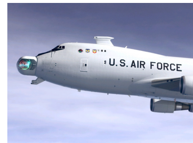
Northrop Grumman ist ein US-amerikanischer Hersteller von Rüstungstechnik.

Bei Investments in Rüstungsunternehmen wird sehr oft über Moral diskutiert. Zugegeben: Aktien von Rüstungskonzernen profitieren vor allem in Krisenzeiten. Es muss aber auch daran gedacht werden, das Unternehmen wie Northrop Grumman nicht verantwortlich für die Konflikte sind. Auch stellt der Konzern nicht ausschließlich Waffen und Munition her. Das US-Unternehmen ist auch auf Informationstechnologie spezialisiert und ebenso im Schiffsbau sowie in der Luft- und Raumfahrtbranche tätig. Die Aktie von Northrop Grumman entwickelt sich wie an der Schnur gezogen nach oben. In den letzten zwei Jahren hat sich der Kurs verdoppelt. Auch die Zukunftsaussichten stimmen. Der Markt für Rüstungsausgaben wächst weltweit seit Jahren und beträgt aktuell knapp 1,8 Billionen Dollar. Daher sehen auch die Analysten langfristig noch deutliches Kurspotenzial. Goldman Sachs rechnet mit einem Kursanstieg von 30 Prozent.