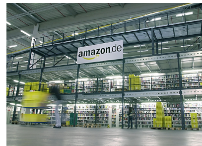
Amazon.com hat die Gewinnerwartungen deutlich übertroffen

Noch im Januar notierte die Aktie im Tief bei 287 Dollar, dann erfolgte die Vorlage der Quartalszahlen und diese wurden von den Anlegern euphorisch gefeiert. Die Aktie hat inzwischen 30 Prozent zugelegt und notiert bei knapp 375 Dollar. Der Konzern hat für das vierte Quartal 2014 mit 214 Millionen Dollar einen Gewinn ausgewiesen. Der Nettogewinn betrug 0,45 Dollar je Aktie bei einem gegenüber dem Vorjahr um 15 Prozent gesteigerten Umsatz von 29,33 Milliarden Dollar. Die Experten hatten nur mit einem Gewinn von 0,17 Dollar je Aktie bei einem Umsatz von mindestens 29,68 Milliarden Dollar gerechnet. Blendend lief vor allem das Geschäft mit Videostreaming. Genaue Zahlen gab Amazon zwar nicht bekannt, verriet jedoch, dass die Zahl der Abonnenten im vergangenen Jahr um 53 Prozent gestiegen war. Die Aktie von Amazon ist Bestandteil des TSI-Fonds.