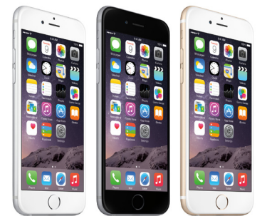
Apple plant 2015 offenbar drei iPhone-Modelle.

Die Apple Watch ist noch gar nicht im freien Verkauf und schon gibt es Gerüchte, dass demnächst weitere Apple-Produkte auf den Markt kommen. So sollen wohl im Herbst neue iPhone-Modelle vorgestellt werden. Nach Angaben des Branchenmagazins Digitimes könnte Apple allerdings statt wie gewohnt zwei Modelle drei iPhones einführen. Am 24. April werden die Geschäftszahlen für das letzte Quartal und auch die Verkaufszahlen der iPhones veröffentlicht. Die Quartalsergebnisse dürften Prognosen zufolge erneut gut ausfallen, da weiterhin starke iPhone-Absatzzahlen prognostiziert werden und das Smartphone 70 Prozent der Umsätze generiert. Apple befindet sich seit Kurzem im TSI-Fonds. Es wird darauf spekuliert, dass sich der Aufwärtstrend der Aktie weiter fortsetzt.