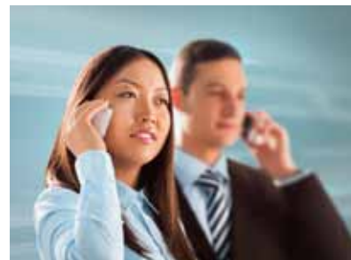
Beim Mobilfunkanbieter Drillisch laufen die Geschäfte rund.

Gute Nachrichten hat der Depotwert Drillisch gemeldet. Der Mobilfunkanbieter hat nach Zuwächsen im dritten Quartal seine Jahresprognose bestätigt. Das Ergebnis vor Zinsen, Steuern und Abschreibungen (EBITDA) dürfte 2014 das obere Ende der ursprünglichen Prognose von 82 bis 85 Millionen Euro erreichen, teilte das TecDax-Unternehmen in der vergangenen Woche mit. Im dritten Quartal hatte Drillisch das EBITDA um 23,4 Prozent auf 22,2 Millionen Euro gesteigert. Der Umsatz legte um 2,9 Prozent auf 70,2 Millionen Euro zu. Die Zahl der Kunden konnte das Unternehmen vor allem im profitablen Budget-Geschäft um mehr als die Hälfte auf 1,02 Millionen steigern.