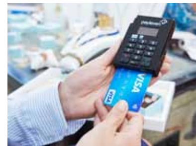
Wirecard weitet die Zusammenarbeit mit Visa aus.

Wirecard befindet sich zweifellos auf Wachstumskurs – Gewinn und Umsatz klettern zweistellig. Trotz zuletzt guter Kursentwicklung sind noch höhere Kurse wahrscheinlich. Das Analysehaus Warburg Research hat das Kursziel für Wirecard nach Zahlen von 38 auf 42 Euro angehoben und die Einstufung auf „Buy“ bestätigt. Als Grund nannten die Experten gute Quartalszahlen. Dem Zahlungsabwickler ist es zudem gelungen, die Zusammenarbeit mit Visa auszuweiten. Wirecard übernimmt für 16 Millionen Dollar Firmenteile von Visa in Indien und Singapur. Die Zusammenarbeit betrifft mehr als drei Millionen Kunden und bezieht sich auf sogenannte Prepaid-Karten. Der asiatisch-pazifische Raum ist nach Unternehmensangaben weltweit einer der wachstumsstärksten Märkte für Prepaid-Karten.