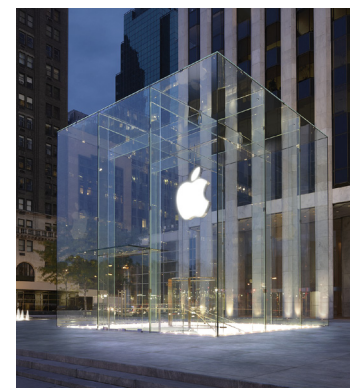
iPhone und Co sind weiterhin in Mode. Der Umsatz von Apple brummt.

Vor allem dank den starken Verkaufszahlen der iPhones hat Apple im letzten Quartal ein sehr gutes Ergebnis erzielt. Im Ende März abgelaufenen Jahresviertel legten der Umsatz und der Gewinn im Vergleich zum Vorjahr zu. Auch die Dividende soll steigen. Insgesamt schüttet der US-Konzern in den nächsten zwölf Monaten eine Gesamtsumme von rund 12,1 Milliarden Dollar aus und ist damit der größte US-Dividendenzahler. Auch im Dividende 4 Plus Fonds ist die Apple-Aktie mit einer Gewichtung von über drei Prozent vertreten. Seit Einstand liegt die Position rund 40 Prozent im Plus.