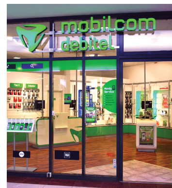
Das Geschäft bei Freenet brummt – dies zeigten die jüngsten Zahlen.