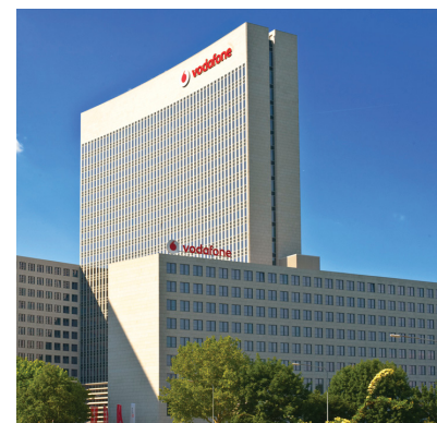
Bei Vodafone schaut die Zukunft wieder freundlicher aus.

Der Mobilfunkanbieter Vodafone ist nach fast drei Jahren wieder aus eigener Kraft gewachsen. Insgesamt kletterte der Umsatz um 10,1 Prozent auf 42,2 Milliarden Pfund. Der Nettogewinn betrug 5,92 Milliarden Pfund. Positiv: Vodafone will die Dividende von derzeit 7,62 Pence je Aktie in Zukunft jährlich steigern. Zusätzlichen Schwung brachten Aussagen des US-Milliardärs John Malone. Er betonte, dass sein Medienkonzern Liberty Global gut zu Vodafone passen würde. Die Vodafone-Aktie ist auch im Dividende 4 Plus Fonds vertreten. Seit dem Einstieg notiert die Position knapp 15 Prozent im Plus.