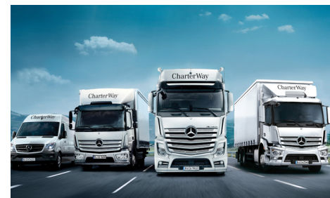
Die Analysten bleiben optimistisch für Daimler.