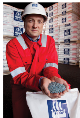
Der norwegische Chemiekonzern YARA stellt unter anderem Kunstdünger her.

Zu den Top-Performern im Dividende-4-Plus-Fonds zählt YARA. Die Position liegt seit dem Kauf 46 Prozent im Plus. Nach einer mehrmonatigen Konsolidierungsbewegung ist die YARA-Aktie zuletzt wieder durchgestartet. Ein Ende der Aufwärtsbewegung ist noch lange nicht in Sicht. Von insgesamt 32 durch die Nachrichtenagentur Bloomberg befragten Analysten sprechen sich 23 dafür aus, die Aktien des norwegischen Chemiekonzerns zu kaufen oder weiterhin zu halten. Zuletzt bestätigte auch die US-Investmentbank Merrill Lynch die Kaufempfehlung für den Wert.