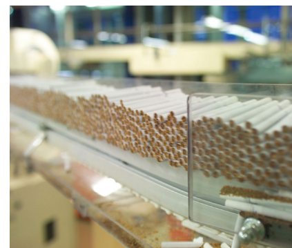
Allen Warnhinweisen zum Trotz – Zigaretten kommen immer noch gut an.

Zu den Top-Gewinnern im Fonds mit einem Plus von fast fünf Prozent zählt Altria. Der Zigarettenkonzern hat einen Marktanteil von rund 55 Prozent. Zu den vom US-Konzern produzierten Zigarettenmarken zählen beispielsweise Marlboro, Chesterfield oder L&M. Seit Kauf notiert die Position bereits rund 30 Prozent im Plus. Laut den von der Nachrichtenagentur Bloomberg befragten Experten hat die Aktie noch Luft nach oben. Das durchschnittliche Ziel lautet 57,20 Dollar – was einem Kurspotenzial von rund zwölf Prozent entspricht. Zudem lockt eine Dividendenrendite von über vier Prozent.