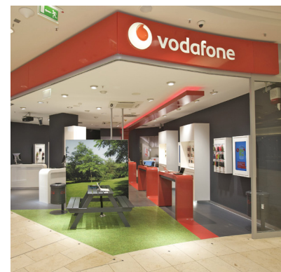
Beim Telekomkonzern Vodafone laufen die Geschäfte mittlerweile besser.

Der britische Telekomkonzern Vodafone hat die Zahlen für das erste Quartal des laufenden Geschäftsjahres präsentiert. „Wir sind gut ins Jahr gestartet“, so Konzernchef Vittorio Colao. Das Unternehmen hat nun zum zweiten Mal in Folge die Serviceumsätze im Quartal aus eigener Kraft steigern – und das aus Expertensicht mit 0,8 Prozent überraschend deutlich. Für Colao und sein Management bestand nach den ersten drei Monaten kein Anlass, den Ausblick auf das Geschäftsjahr 2015/16 zu verändern. Colao verwies auf die wachsende Nachfrage nach mobilen Datendiensten in den Netzen der Briten.