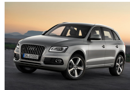
Volkswagen toppt die Erwartungen – dank Porsche und Audi.

Nach wochenlangem Machtkampf an der Führungsspitze lässt der Autobauer VW mal wieder die Zahlen sprechen – und die sind für das Startquartal gut ausgefallen. Insgesamt fuhr Europas größter Autohersteller einen Umsatz von 52,7 Milliarden Euro ein, das sind zehn Prozent mehr als ein Jahr zuvor. Analysten hatten im Schnitt mit einem Wert von 50,5 Milliarden Euro gerechnet. Das Betriebsergebnis wuchs um 17 Prozent. Vor allem Audi und Porsche erwiesen sich als Gewinnstreiber. 65 Prozent steuerten beide zum EBIT bei, welches insgesamt bei 3,3 Milliarden Euro lag. Die Vorzugsaktie auf VW ist mit 2,6 Prozent im TSI-Fonds gewichtet.