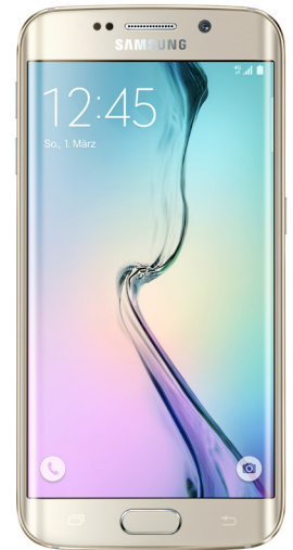
Chips von Dialog Semiconductor befinden sich in Produkten von Samsung.

Mit 2,6 Prozent ist die Aktie von Dialog Semiconductor im TSI Fonds gewichtet. Zuletzt hat der Chipentwickler die Anleger mit starken Zahlen überrascht. Der Umsatz kletterte gegenüber dem ersten Quartal 2014 um 41 Prozent auf 311 Millionen Dollar und übertraf damit die Ziele des Managements von 265 bis 300 Millionen Dollar um Längen. Neben dem starken Wachstum, das in großen Teilen auf den Erfolg des iPhones zurückzuführen ist, überzeugt vor allem die hohe Profitabilität. Die Bruttomarge kletterte auf 46 Prozent im ersten Quartal. Auch beim Gewinn lag Dialog weit über den Erwartungen. Statt 52,4 Millionen Dollar, wie die Analysten im Durchschnitt erwartet hatten, verdiente der Konzern 55,6 Millionen Dollar. Die Aktie stieg daraufhin um fast zehn Prozent auf ein Allzeithoch.