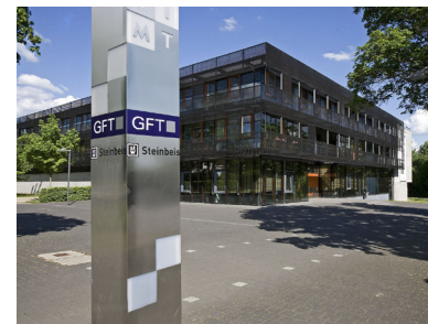
Bei den Papieren von GFT Technologies sehen die Analysten noch Potenzial.