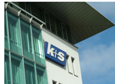
Die Analysten sind optimistisch für die K+S-Aktie.