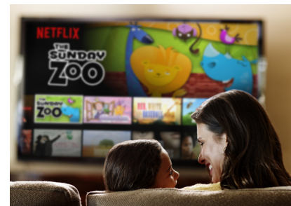
Immer mehr Kunden weltweit streamen das Programm von Netflix.

Bereits seit Anfang des Jahres präsentiert sich die Aktie von Netflix sehr stark. Davon profitiert auch der Patriarch Classic TSI Fonds. Hier zählt der Wert zu den Top-5-Positionen. Ein Ende der Rallye scheint dabei noch lange nicht in Sicht. Netflix treibt seine Expansionspläne immer weiter voran. Das Unternehmen bietet seinen Dienst bereits in ganz Amerika an und hat im letzten Jahr einen großen Schritt nach Europa gemacht. Bei den Expansionsplänen hilft Netflix sowohl sein starker Markenname, seine große Medienbibliothek als auch seine eigenen produzierten Serien und Filme.