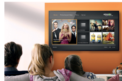
Nicht nur Pakete – Amazon bietet mittlerweile auch Video on Demand an.