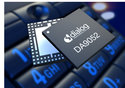
Die Geschäfte von Dialog Semiconductor laufen hervorragend.